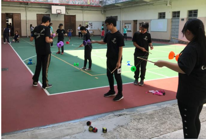
同學們非常投入百戲導賞工作坊活動