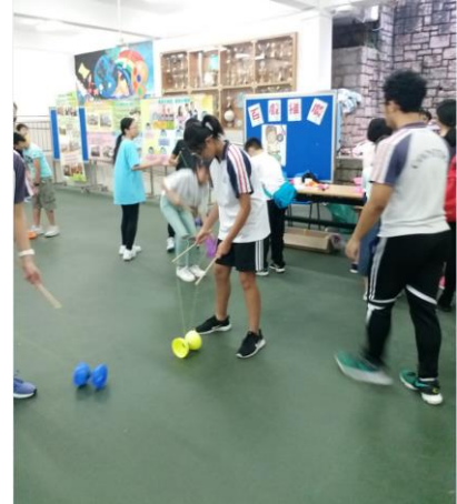
同學們親身體驗百戲活動