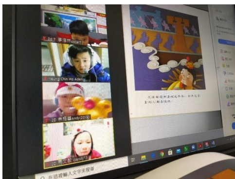
老師以 ZOOM 形式進入 2 年級課室說故事