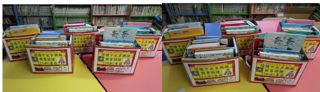
180 多本圖書分別放入不同 2 年級課室，同學能投入閱讀

於二年級班房配置 182 本中國歷史有關的圖書供學生閱讀。從不同的書局去尋找及購置可供 2 年級閱讀的中國歷史及文化圖書，配合環保書箱放入各班課室以供學生閱讀，2 年級每班配置 30 本多本有關中國歷史及文化的圖書，學生於早讀、小息及可供閱讀的時間進行閱讀，部分學生用心閱讀有關圖書，從閱讀中加深學生對中國歷史的認識及提高學生接觸中國歷史的興趣。