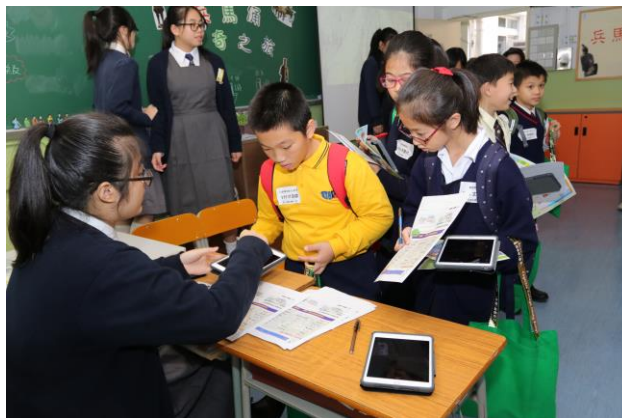
參加者正進行兵馬俑遊戲

第四部份：由中四及中五修讀中國歷史同學帶領參加者進行不同級別遊戲，以鞏固參加者對兵馬俑的認識。遊戲分為入門級、進階級及挑戰級(見遊戲工作紙)