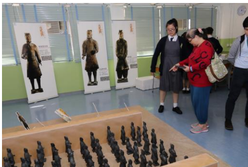
本校同學向嘉賓介紹兵馬俑展覽