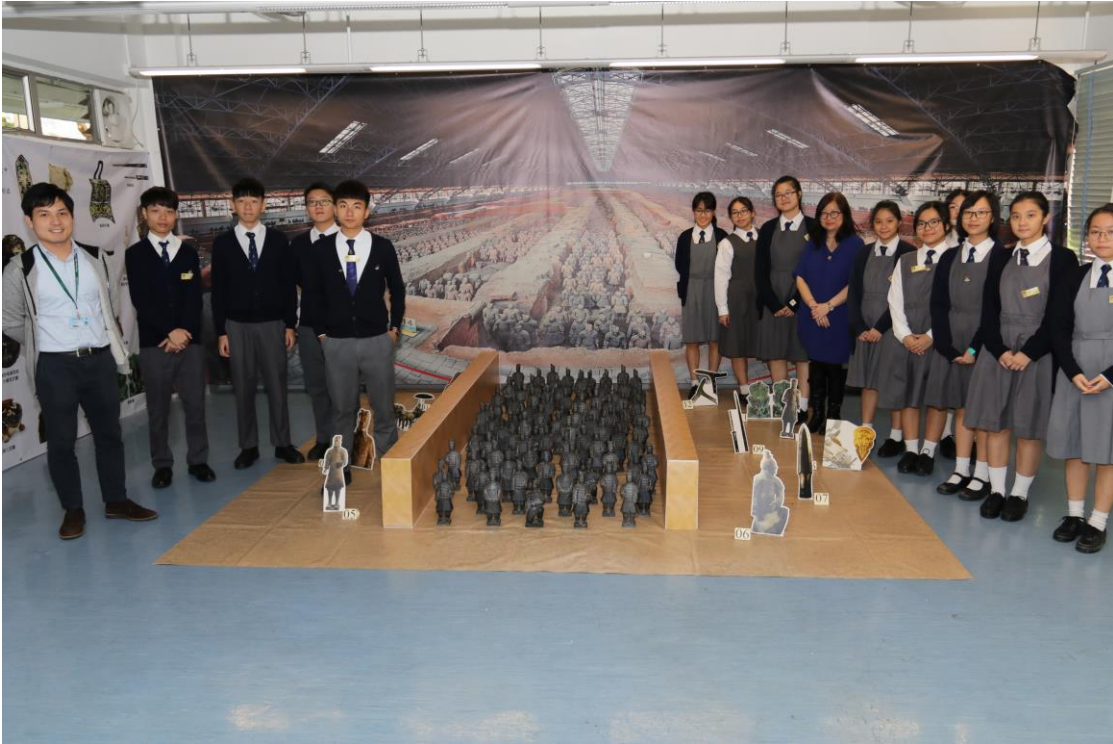
本校製作「重現兵馬俑」工作人員