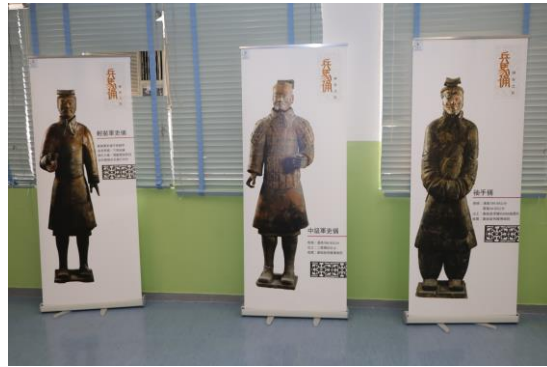
由本校高中修讀中國歷史同學製作的兵馬俑展板

第三部份：由高中同學帶領參加者觀看兵馬俑復原展品，從而重現「兵馬俑」，以此了解秦軍的佈陣。