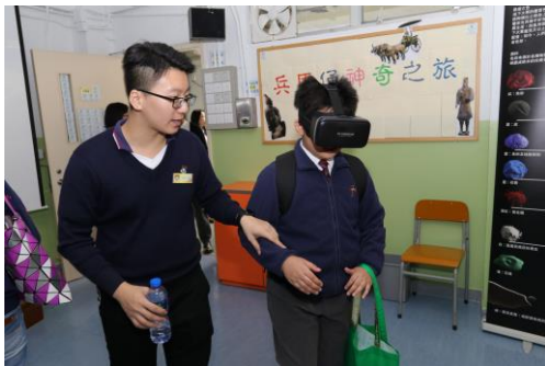
由本校同學向參加者介紹虛擬實境短片