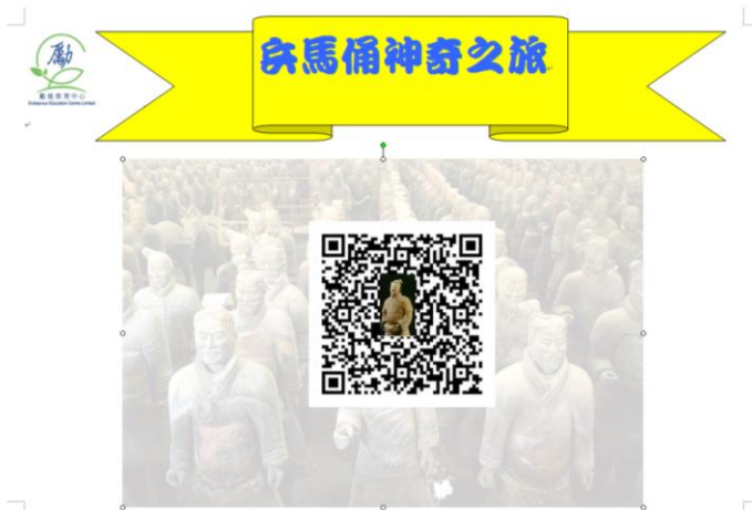
「神奇之旅短片 QR code

第一部份：先讓參加者戴上VR眼鏡，觀看有關陝西兵馬俑博物館虛擬實境影片，讓參加者感受兵馬俑神奇之旅。