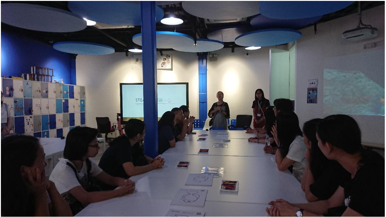
古蹟 VR 製作工作坊