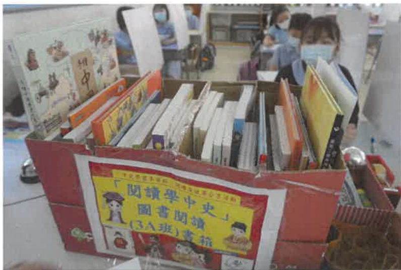
在課室放置可供學生閱讀的中國歷史文化圖書