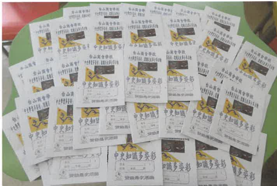
創作及印製小冊派發給同學在家閱讀

出版「中史知識多姿彩」小冊：學生用小冊自學中國歷史知識及自由分享，展示學生佳作。因停課關係亦把小冊子的內容製作成短片，同學在家中自學中國歷史知識。 "中史知識多姿彩"小冊子： https://youtu.be/7R4gkg6o6FY