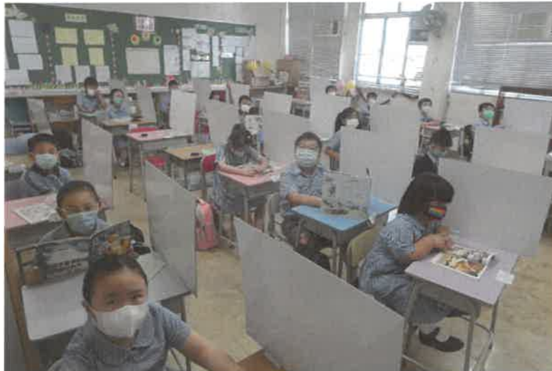
學生在課室認真及用心閱讀中國歷史文化圖書

出版「中史知識多姿彩」小冊：學生用小冊自學中國歷史知識及自由分享，展示學生佳作。因停課關係亦把小冊子的內容製作成短片，同學在家中自學中國歷史知識。 "中史知識多姿彩"小冊子： https://youtu.be/7R4gkg6o6FY