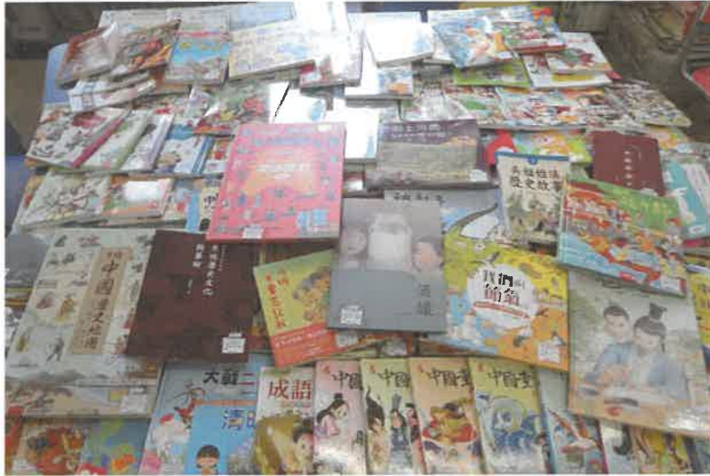
153 本中國歷史圖書供學生閱讀

「閱讀學中史」圖書閱讀：從不同的書店購置優質中國歷史及文化的圖書購買共 153 本圖書，放在三年級班房以供學生閱讀，學生自由選取閱讀，從書本中學習中國歷史知識。