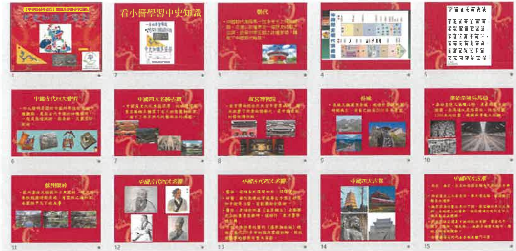
把小冊子的內容製作成短片

「中史知識多姿彩」及問答遊戲：看了「中史知識多姿彩」小冊後，以紙筆問答遊戲增進學生對中史的知識，完成簡單的問題，抽出表現出色的同學給予禮物以作獎勵。