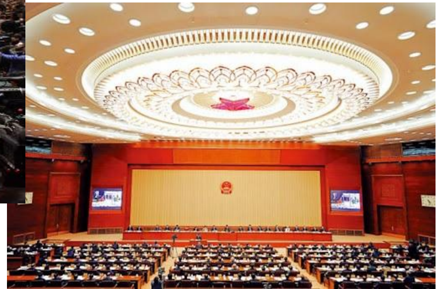
第十三屆全國人民代表大會常委會全體會議