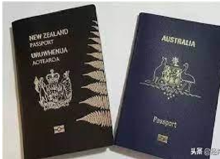
头条 @ 经济