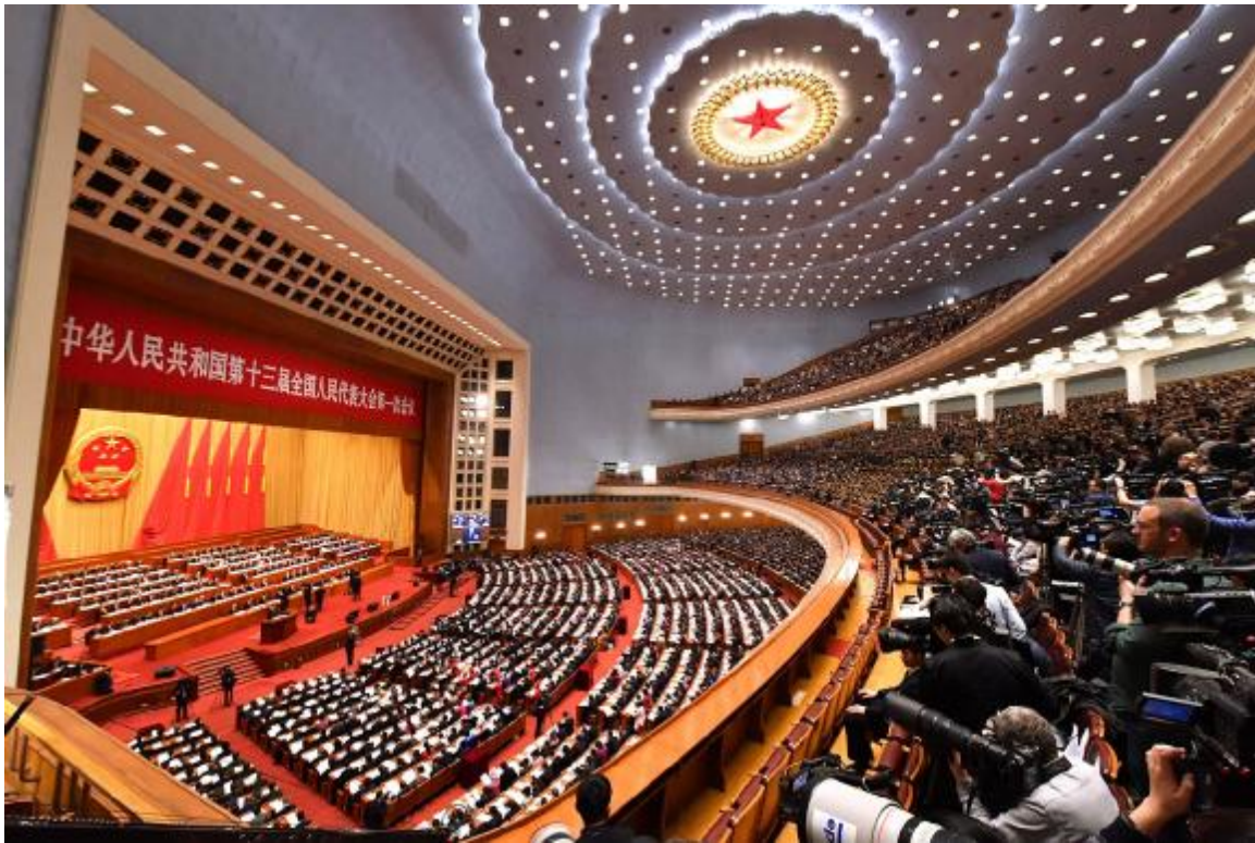
第十三屆全國人民代表大會第一次會議