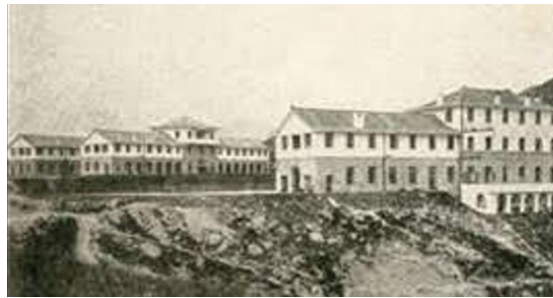
圖一：聖士提反書院舊貌