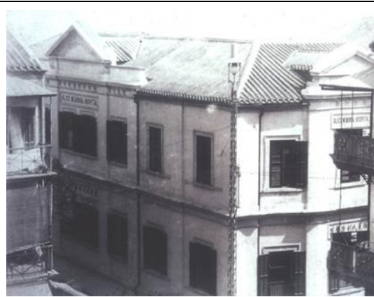
圖二：雅麗氏紀念醫院舊貌